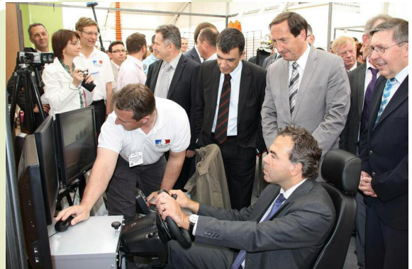
Foire de Chaumont le 6 mai 2011

En 2008, une charte départementale "Tous responsables" signée par l'Etat, le conseil général et l'association des maires a succédé à celle mise en place en 2004 intitulée "Entre droits et devoirs". La plupart des chartes et conventions nationales sont reconduites au niveau local et permettent d'associer d'autres partenaires : convention de partenariat sur la conduite accompagnée des apprentis en 2009 et charte sur la promotion de l'usage de l'éthylotest dans les débits de boissons en 2010.