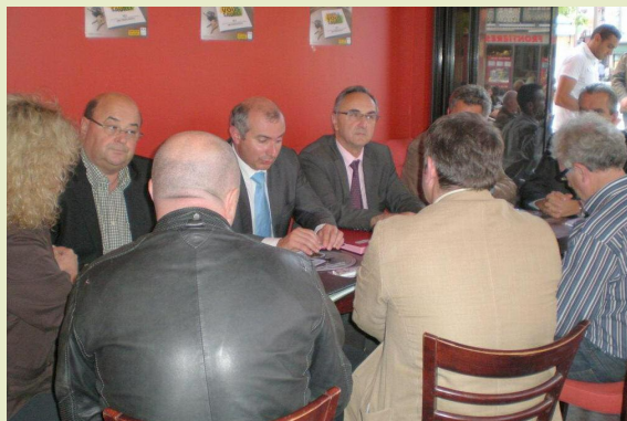
Signature de la charte sur la promotion de l'usage de l'éthylotest dans les débits de boissons le 10 septembre 2010

En 2008, une charte départementale "Tous responsables" signée par l'Etat, le conseil général et l'association des maires a succédé à celle mise en place en 2004 intitulée "Entre droits et devoirs". La plupart des chartes et conventions nationales sont reconduites au niveau local et permettent d'associer d'autres partenaires : convention de partenariat sur la conduite accompagnée des apprentis en 2009 et charte sur la promotion de l'usage de l'éthylotest dans les débits de boissons en 2010.