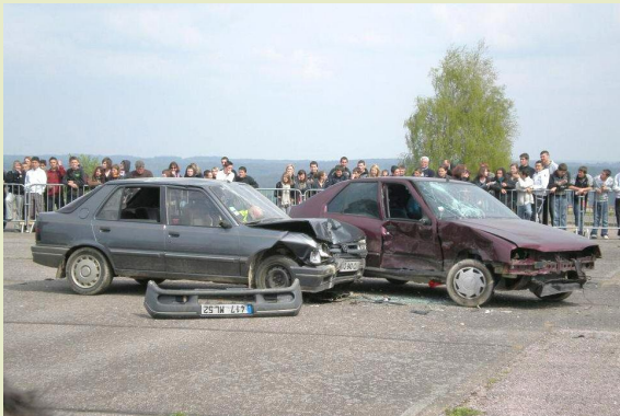
Crash test pédagogique à Langres le 14 avril 2011